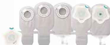
SenSura Mio Kids, pediatrie opvangzakjes