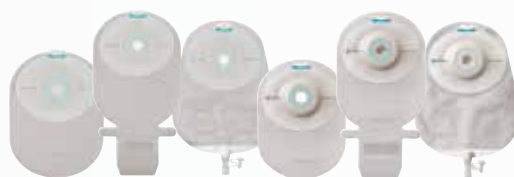
SenSura Mio 1-delig