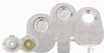
SenSura Mio Click 2-delig