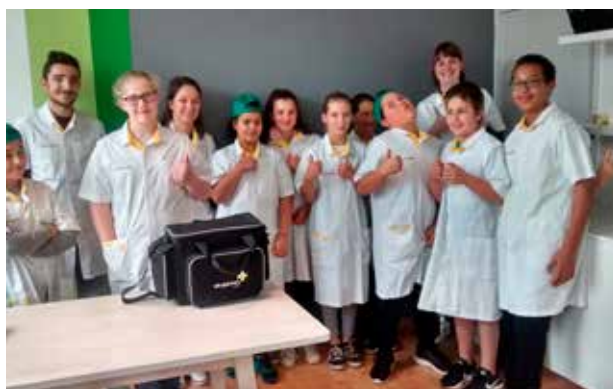
[26/10] DOEDAG HASSELT (PXL) EN GENK (CAMPUS LIZA): KINDEREN UIT HET 6E LEERJAAR KRUIPEN IN DE HUID VAN EEN VERPLEEGKUNDIGE, VROEDVROUW OF ZOR GKUNDIGE.