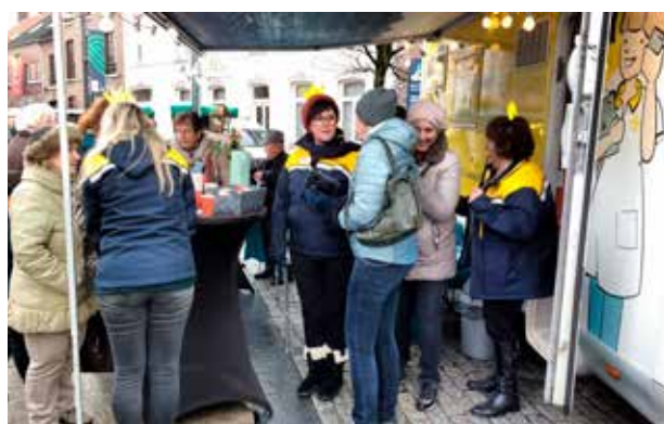
[OKTOBER - DECEMBER] WGK OP DE MARKT: MET ONZE MOBILHOME BEZOEKEN WE ALLE LIMBURGSE MARKTEN. BEZOEKERS KUNNEN ONS HUN VRAGEN OVER THUISZORG STELLEN EN WIJ VRAGEN HEN NAAR HUN MENING OVER HET WIT-GELE KRUIS.