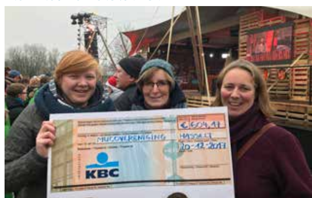
[22/12] WIT-GELE KRUIS HASSELT STEUNT MUCOVERENIGING EN ZAMELT GELD IN VOOR HET GOEDE DOEL (DE WARMSTE WEEK).