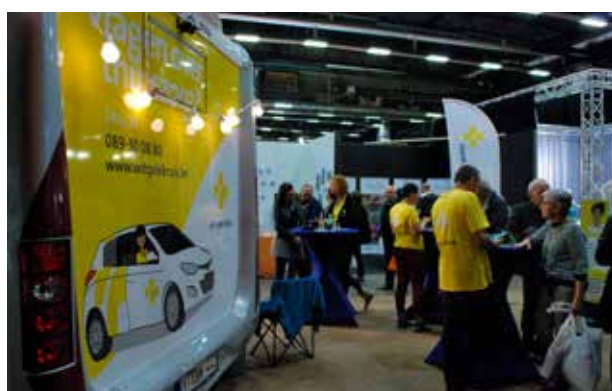
[10 - 12/11] 50+EXPO/RELIFEBEURS LIMBURGHAL GENK.