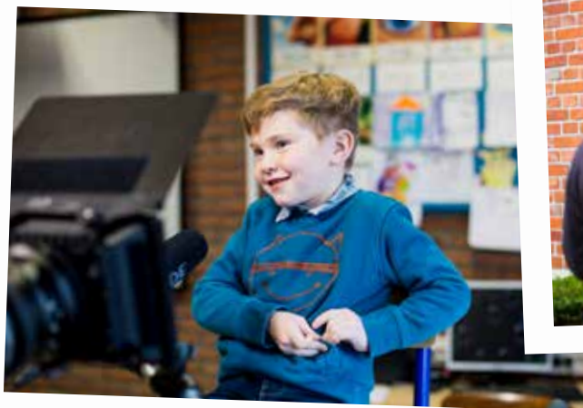
Enkele patiënten getuigen voor de camera over hun warme band met de thuisverpleegkundige.