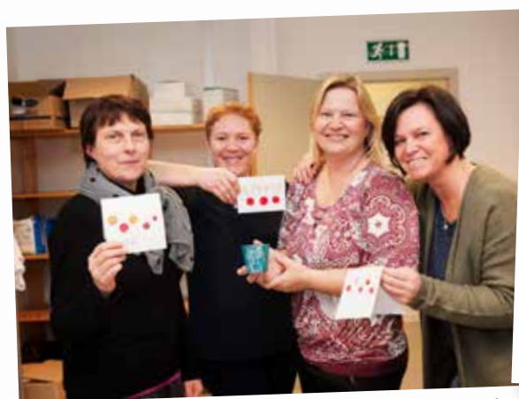
Onder meer de afdelingen Mechelen-Puurs en Geel zetten zich in voor 'De Warmste Week' van Studio Brussel.