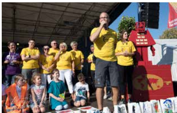
LEVENSLLOOP GENK (14-15/10)

HET WIT-GELE KRUIS LIMBURG STEUNT DE STRIJD TEGEN KANKER!