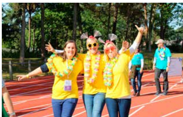
LEVENSLLOOP IN LOMMEL (16-17/9)