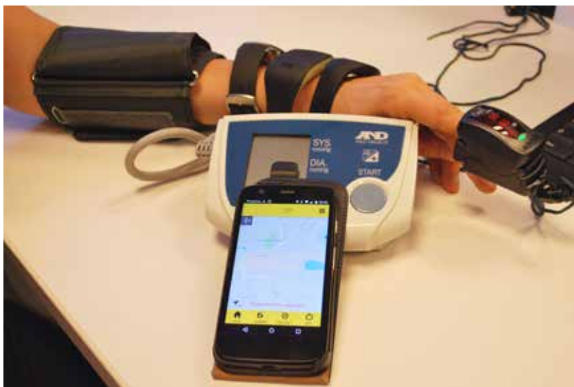
DE BLOEDDRUKMETER BEGELEIDT JE OM EEN JUISTE METING TE DOEN EN STUURT DE GEGEVENS DOOR NAAR JE DOKTER.

Waarschijnlijk heb je al eens gehoord van een personenalarm (foto 2)? Ben je vaak alleen en voel je je niet steeds op je gemak, bijvoorbeeld omdat je al eens gevallen bent? Dan brengt dit hulpmiddel soelaas. Het bestaat uit een eenvoudige drukknop die je om je hals of rond je pols draagt. Door een druk op de knop