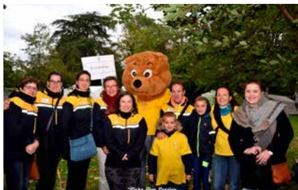
LEVENSLLOOP SINT-TRUIDEN (7-8/10)