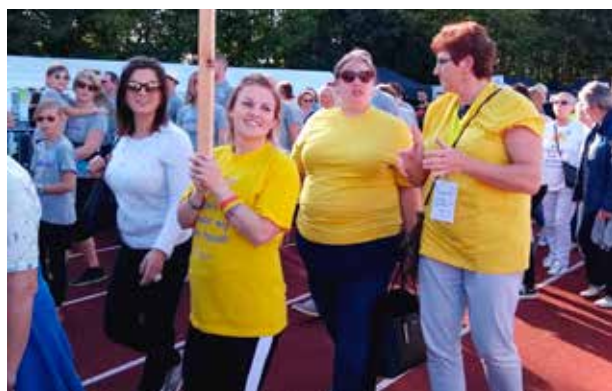
LEVENSLLOOP TESSENDERLO (23-24/9)

Jaar na jaar zijn onze collega's present op de verschillende edities van Levensloop in Limburg. Tijdens dit feestelijk evenement draait alles rond solidariteit met wie lijdt aan kanker en fondsenwerving om de strijd tegen kanker kracht bij te zetten. De sterren van de dag zijn de mensen die kanker overleefden of er nog tegen vechten. Centraal