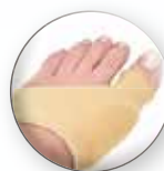
Hallux valgus kussen