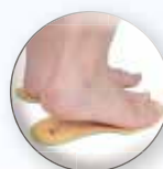
Inlegzool leder + poron