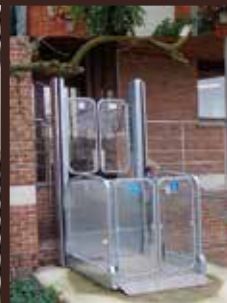
MPR - Strategos