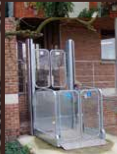
MPR - Strategos