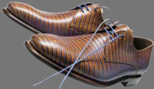
Floris van Bommel®