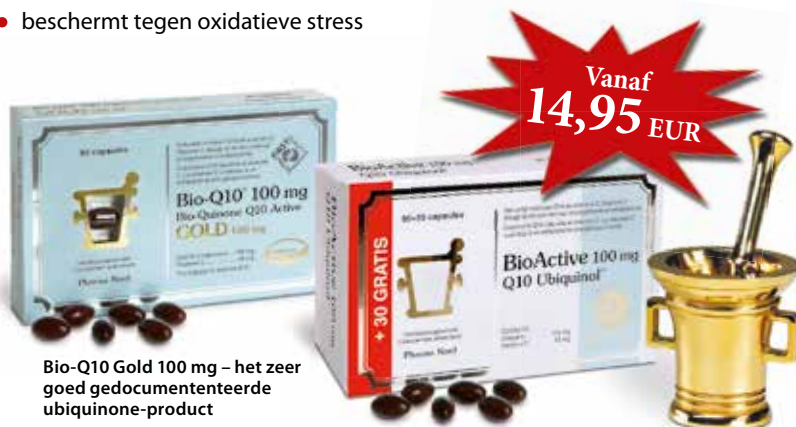
Bio-Q10 Gold 100 mg – het zeer goed gedocumenteerde ubiquinone-product

BioActive Q10 met vitamine C is een revolutionair voedingssupplement dat de energieproductie van het lichaam ondersteunt. De Q10 in Bioactive Q10 bevat natuurlijk coënzym Q10 en kent een zeer goede opname. Dat zorgt voor een sterke en snelle werking.